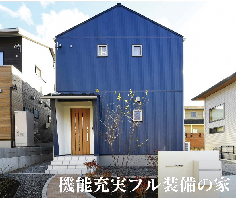
機能充実フル装備の家

もし、あなたが一生に一度の住いづくりを真剣にお考えになられていたらぜひ、エルハウスの見学会にご参加下さい。ご参加いただいてもしつこい営業は一切ありません。会場でお待ちしております。