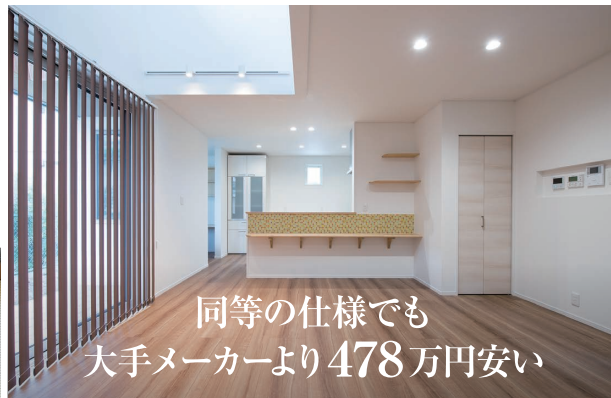
同等の仕様でも 大手メーカーより478万円安い