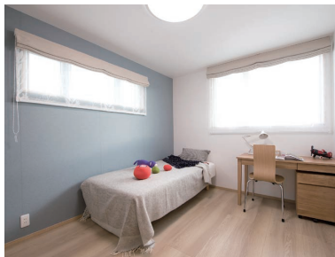
エルハウスお客様の家 内観・外観。今回見学会でご覧いただく家とは異なります。